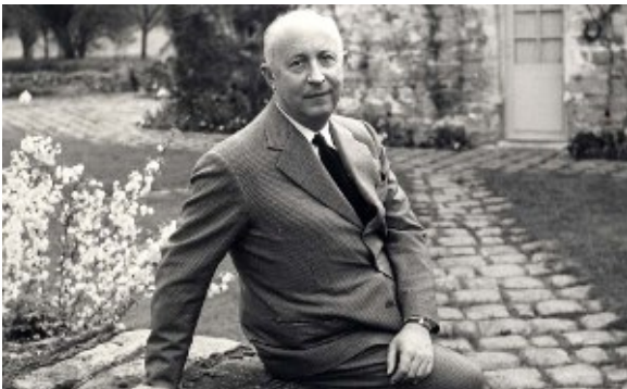
El diseñador Christian Dior.